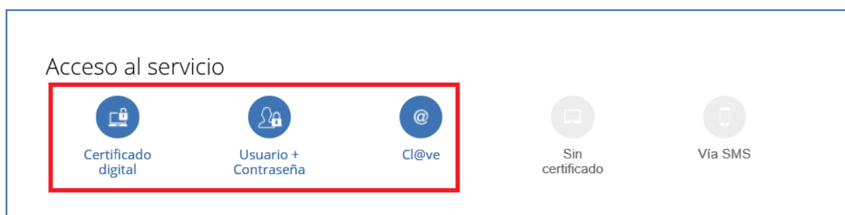
Ilustración 2: Botones con las autenticaciones para acceder al servicio

Para acceder a este servicio compruebe los requisitos técnicos necesarios.