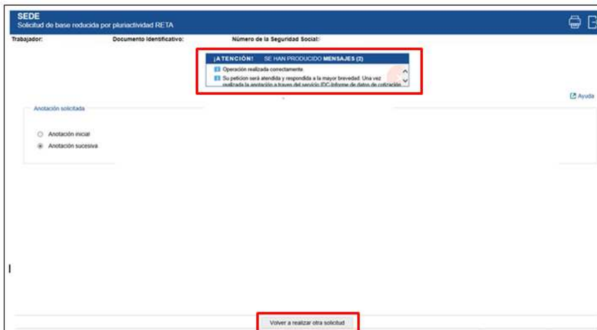
Ilustración 9: Confirmación solicitud anotación sucesiva de la base reducida por pluriactividad.

Si se pulsa Volver a realizar otra solicitud , se regresará a la pantalla anterior.